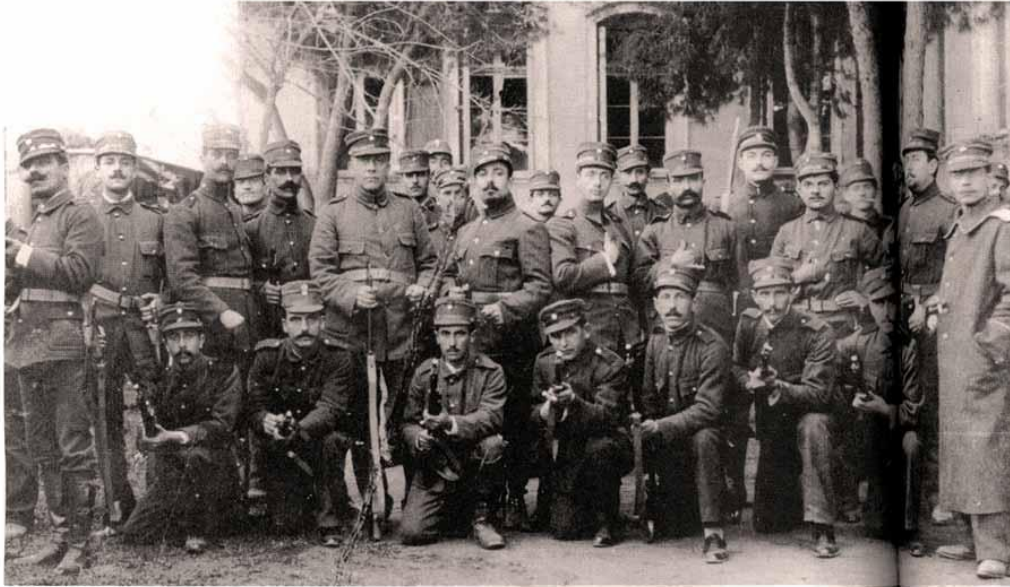
Ομάδα Κύπριων εθελοντών στην αυλή της Ριζαρείου Σχολής στην Αθήνα, σ' ένα διάλειμμα των στρατιωτικών γυμνασίων