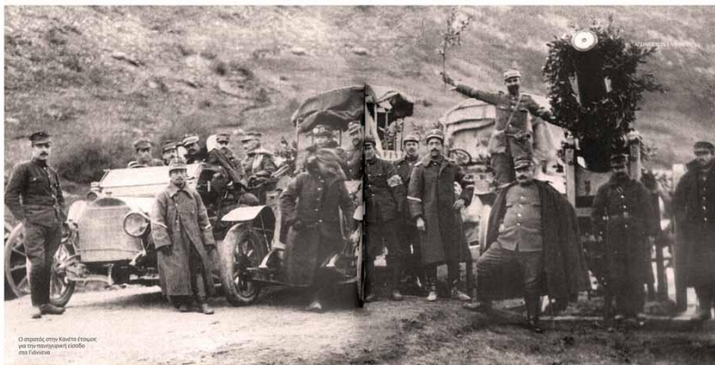
Ο στρατός στην Κωνσταντινούπολη για την πατριωτική είσοδο στα Γιάννινα