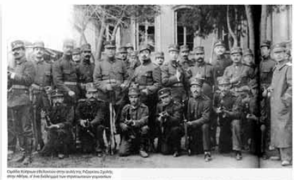
Κυπριακή ομάδα εθελοντών στρατιωτών, Πάρις, 1912-1913.